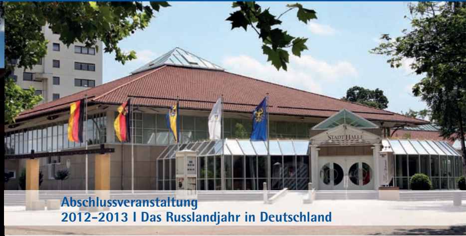
Abschlussveranstaltung 2012-2013 | Das Russlandjahr in Deutschland

Im Laufe des Russlandjahres werden in vielen Regionen Deutschlands zahlreiche Aktivitäten – Feste, Konferenzen, Ausstellungen, Konzerte, Theateraufführungen angeboten, die es ermöglichen, eine breite Öffentlichkeit in Deutschland sowohl mit jahrhundertealten Traditionen Russlands als auch mit den Vertretern des Wirtschaft, Wissenschaftler sowie Künstlern vertraut zu machen.