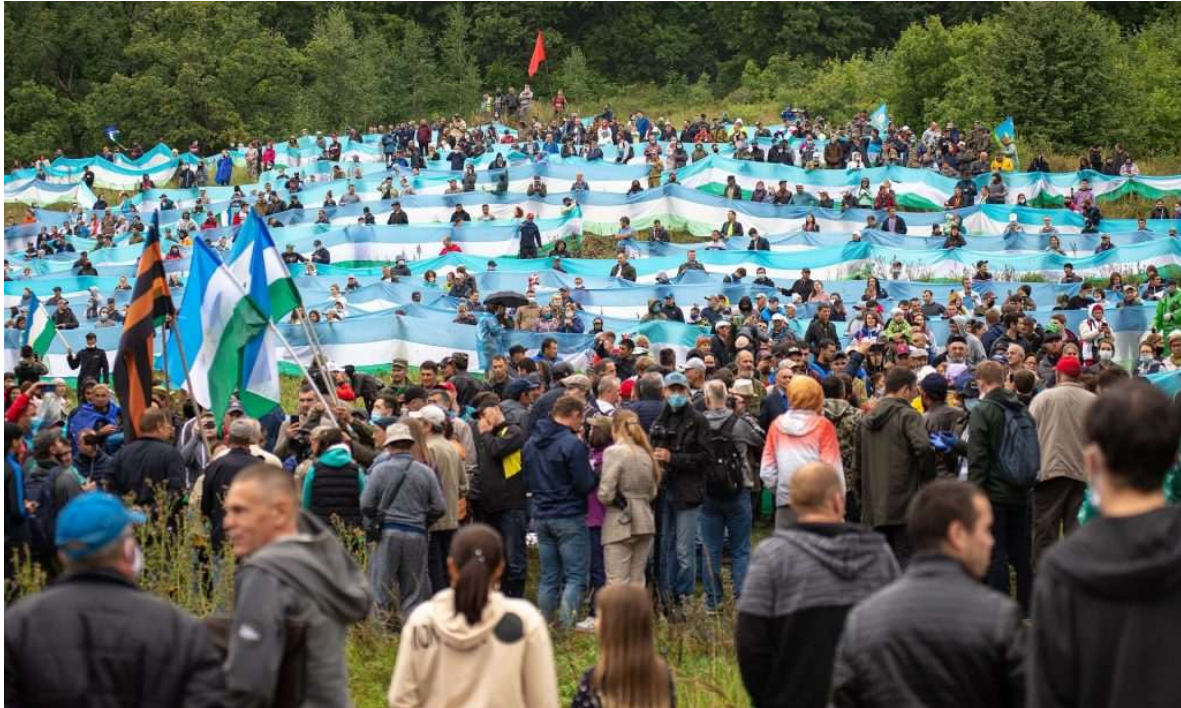
Abb. 4: Flashmob für den Erhalt von Kušttau unter Verwendung einer großen Flagge Baschkortostans am 09.08.2020. Im Vordergrund ist zudem das militärisch-patriotische schwarz-orangene Sankt Georgsbändchen zu sehen, im Hintergrund die Flagge der UdSSR und der russländischen Fallschirmjägertruppen.