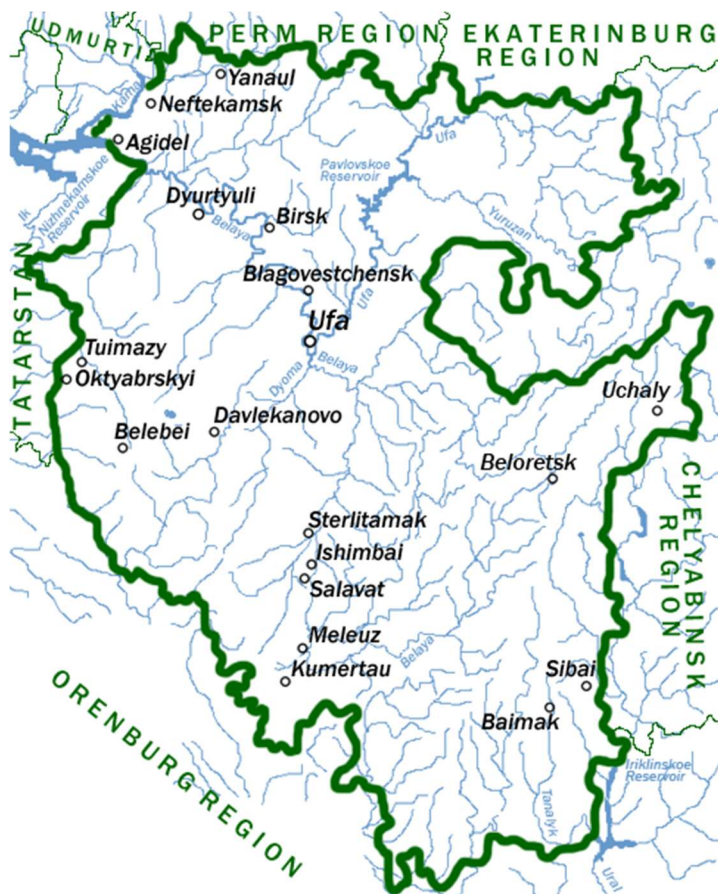
„Map of the Republic of Bashkortostan“. Amazing Tatarstan, o. J. https://tatarstan.eu/maps/maps-neighbouring-regions/map-republic-bashkortostan/ . (abgerufen am 20.07.2025)