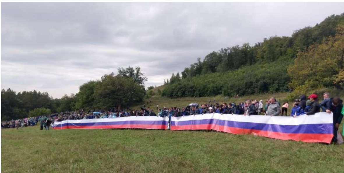
Abb. 5: Spiegelbildliche Aktion zur Unterstützung des Abbaus von Kušttau durch Mitarbeitende von BSK am 15.08.2020 unter Verwendung einer großen Flagge der Russländischen Föderation.