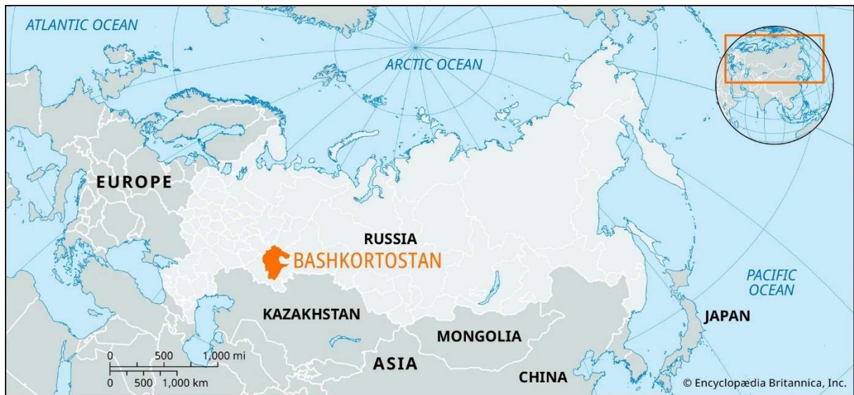
Encyclopædia Britannica Online. „Bashkortostan | Russia, Map, History, & Facts | Britannica“. https://www.britannica.com/place/Bashkortostan . (abgerufen am 20.07.2025)