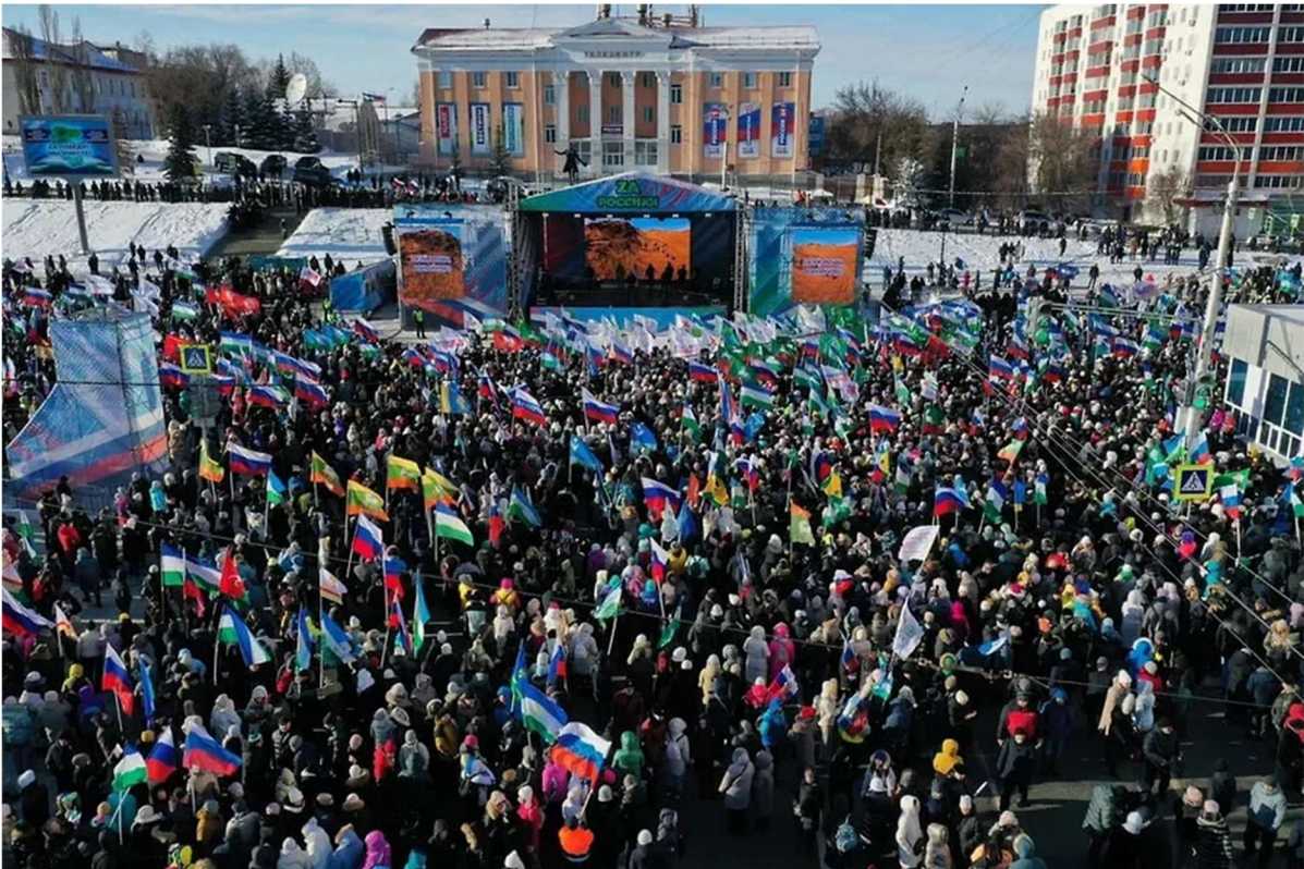
Abb. 7: Kundgebung zur Unterstützung von Radij Chabirov, dem Oberhaupt der Republik Baschkortostan, am 26.01.2024 in Ufa. Neben der Flagge Baschkortostans sind Flaggen der Russländischen Föderation zu sehen. Darüber hinaus wurden Flaggen verschiedener Organisationen, Verbände, Unternehmen und Munizipalitäten gezeigt. Über der Bühne ist das Z-Symbol im Schriftzug „Za Rossiju“ (deutsch: Für Russland) platziert. Die massenfertigten und nicht individuellen materiellen Symbole (Flaggen) sind charakteristisch für staatlich oder institutionell organisierte Kundgebungen (siehe 2.8).