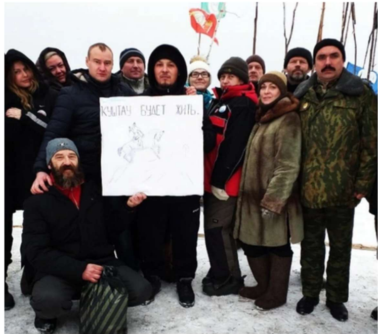
Abb. 2 und 3: Gegenseitige Solidaritätsbekundungen von Aktivisten in Baschkortostan und dem Gebiet Archangel'sk.

Die Frau aus Baschkortostan in Abb.2 hält ein Schild mit der Aufschrift: „Ich/Wir (die Verschränkung der Wörter „Ich“ und „Wir“ ist ein in ganz Russland bekanntes Solidaritätszeichen) bin/sind Kušttau; 22. September Umweltprotest; Baškortostan“ sowie ein Wortspiel basierend auf der gleichlautenden ersten Silbe „Ši“ in den Worten Šies und Šičan.